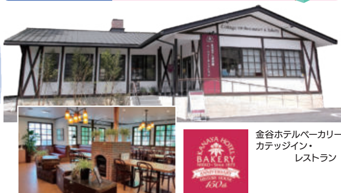
金谷ホテルベーカリー カテッジイン・ レストラン